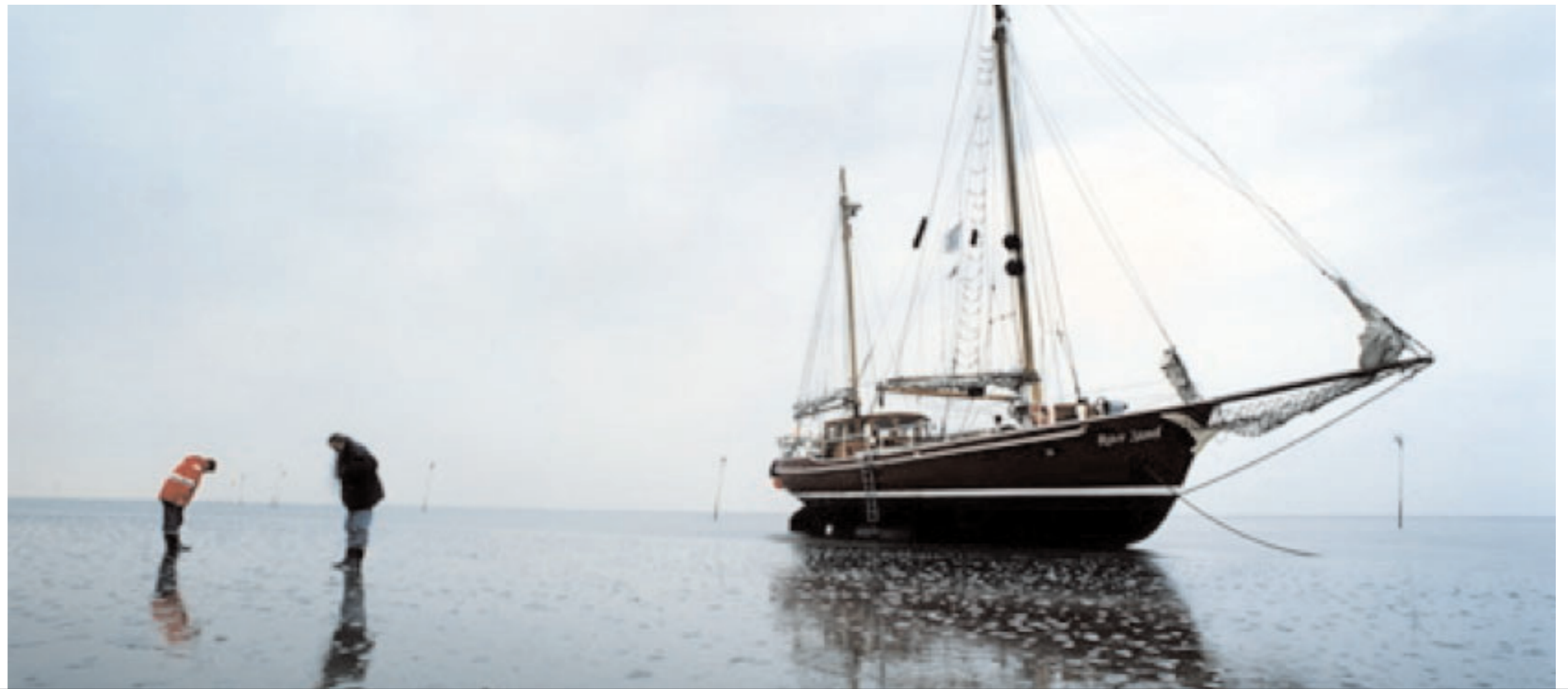
Die „Roter Sand“ wurde 1999 nach alten Plänen neu gebaut. Der